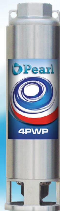
Tabla de Selección