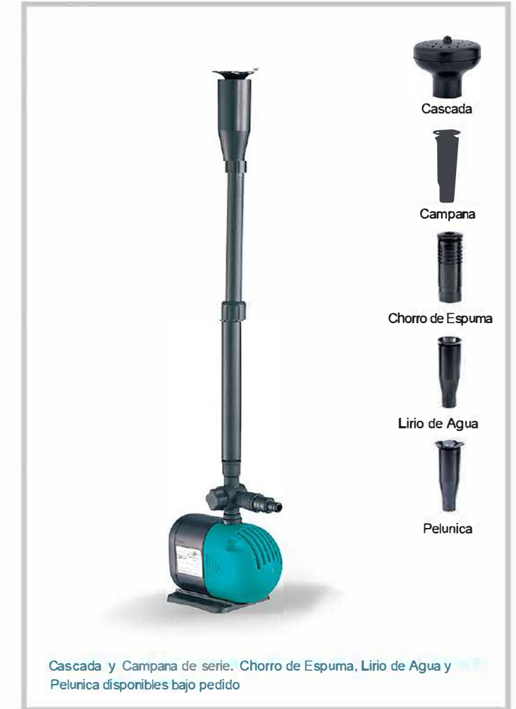
Cascada y Campana de serie. Chorro de Espuma, Lirio de Agua y Pelunica disponibles bajo pedido