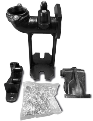
EL CODO DE DESPLAZAMIENTO RDSV2 SE VENDE POR SEPARADO