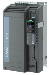
Figura similar Figure similar

Referencia : 6SL3220-3YE38-0UB0 Article No. :